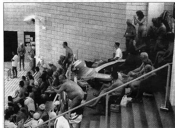
Quelque 180 naturistes européens, dont une quinzaine d'Eurois, ont investi la piscine Jean-Bouin samedi pour une compétition de natation.